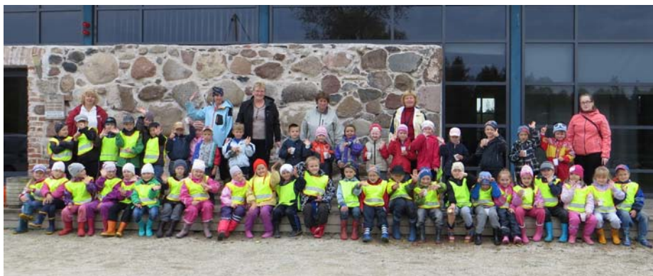
Ühispilt Emajõe-Suursoo keskuse ees.

Projekti „Puhja lapsed vee-elu uurimas“ tegevused on küll selleks korraks läbi, aga Pääsusilmas toimetatakse ikka vanasõna „päeviti ela, aasta mõtle ette“ tähe all. Tänu Keskkonnainvesteeringute Keskusele on rahastuse saanud meie uus projekt – „Puhja lapsed metsa-elu uurimas“. Põnevad õppekäigud ja tegevused on kahel järgneval õppeaastal tulekul, uued teadmised ja kogemused ees ootamas!