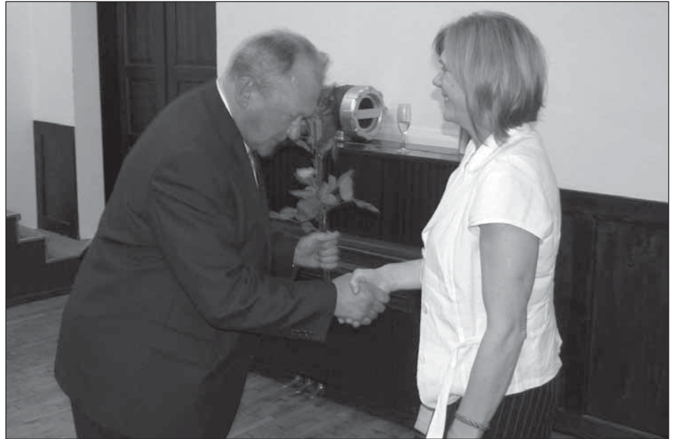
Vallavanem õnnitleb Tartumaa aasta õpetajat.

Puhja vald pole tõenäoliselt mingi murevaba tsoon, aga hea on vahelgi teada, et inimene on tähtsam kui raha.