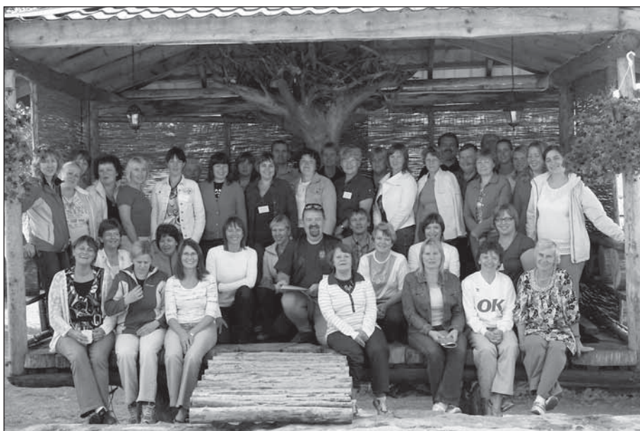
Tartumaa terviseaktiivi esimest kokkusaamist jäi meenutama ühispilt.

Terviselagri läbiviimist toetasid Tervise Arengu Instituut ja Eesti Haigekassa.