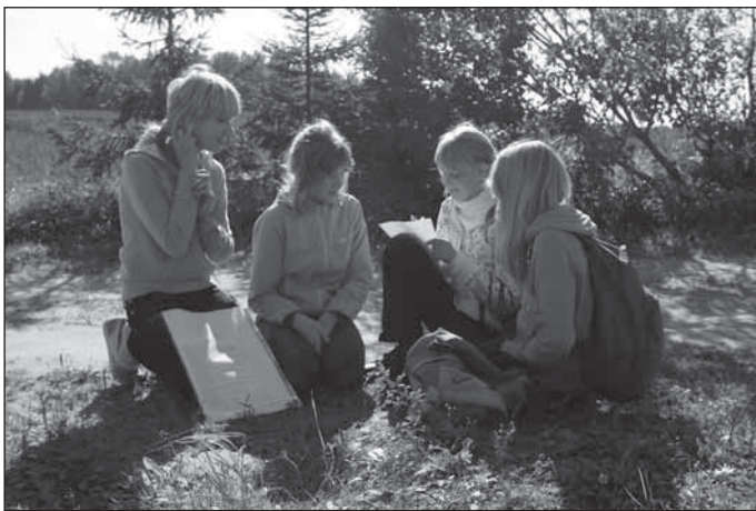
Puhja kodutütred teadmistetest lahendamas.