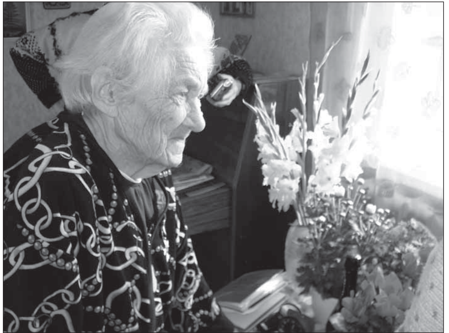
104-aastane sünnipäevalaps.